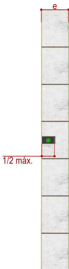
A UN LADO